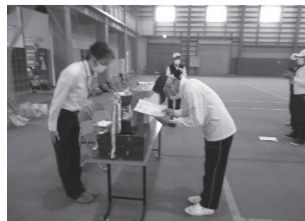
山形中央信用組合理事長杯争奪 西置賜地区中学校バレーボール強化大会