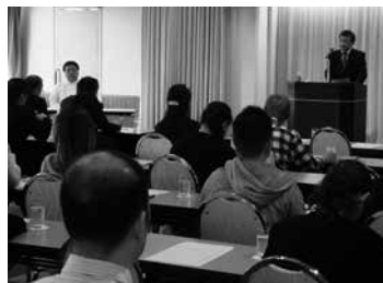
経営者向けセミナー