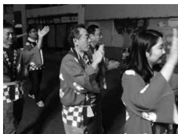
長井おどり大パレード