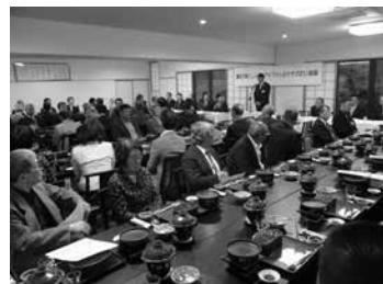
寒河江支店 アドバンスクラブ総会