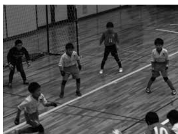
「しんくみ理事長杯」争奪 フットサル大会