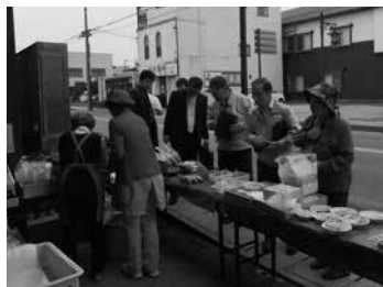
本店営業部 お菓子フェア