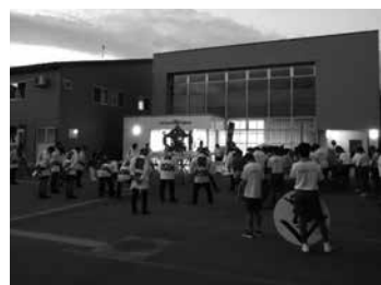
小国二ノ宮稲荷神社大祭