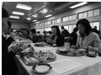
本店営業部 レディースセミナー