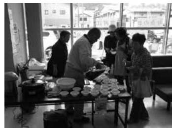
小国支店 そば即売会