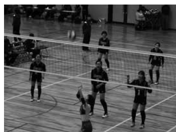
山形中央信用組合理事長杯争奪 西置賜地区中学校 バレーボール強化大会