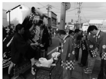
長井黒獅子まつり