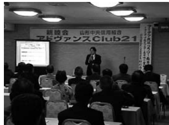
寒河江地区 アドバンスClub