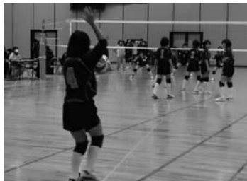
山形中央信用組合理事長杯争奪 西置賜地区中学校 バレーボール強化大会