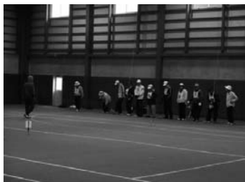
小国支店長杯ゲートボール大会