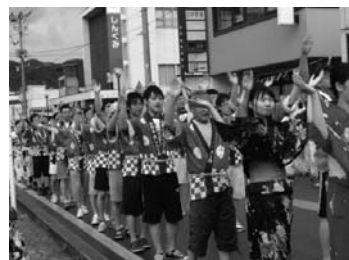
長井踊り大パレード