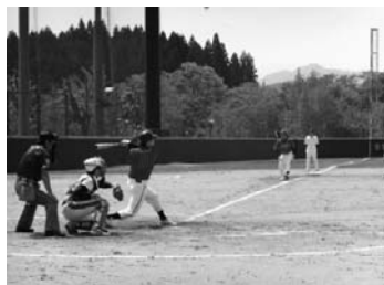
信組杯争奪社会人野球大会