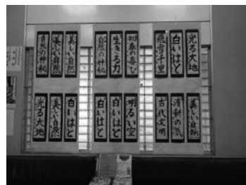
本店営業部 那須書道教室展