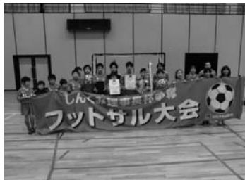
「しんくみ理事長杯」争奪 フットサル大会